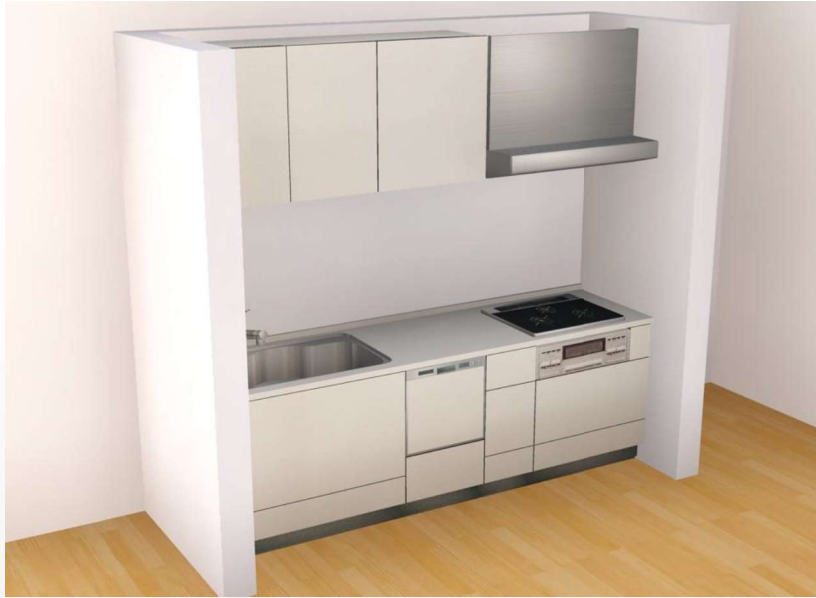
画像はイメージです。